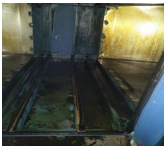
净化器内部清洗前