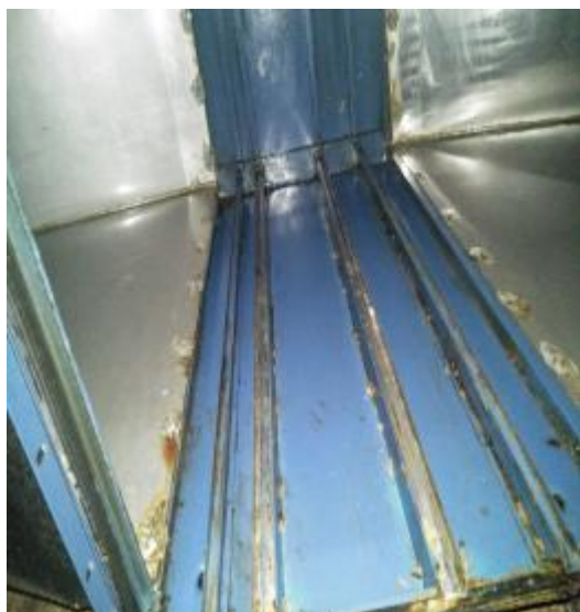
净化器内部清洗后